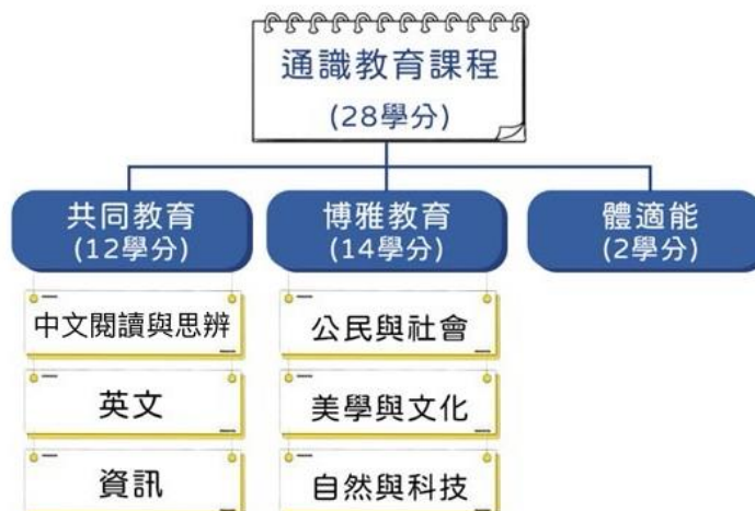
113學年度入學生通識課程架構圖 (進修部)